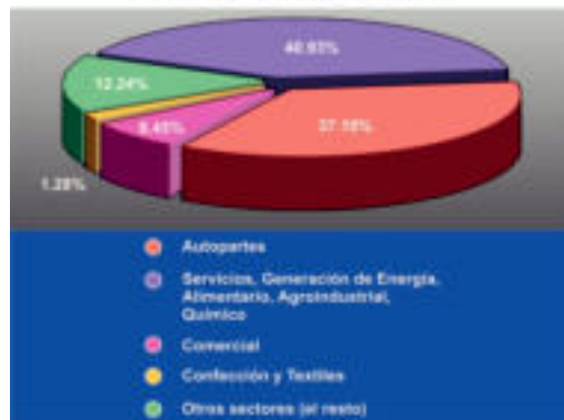
Distribución por sector de la inversión comprometida en lo que va de la administración

En el periodo que se informa hemos promovido el establecimiento de 58 proyectos de inversión por parte del sector privado, con un monto de $USD1,153'760,054 - mil ciento cincuenta y tres